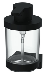
modico lee s'adapte à toute salle de bain

Dotés de supports combinés Adesio, les accessoires de la ligne modico lee peuvent être collés ou vissés. Ils sont disponibles en chromé ou en noir mat. Les verres et les distributeurs de savon existent en trois versions différentes : deux variantes, transparente et mate, en verre véritable, auxquelles s'ajoute celle en Tritan, une matière synthétique robuste et transparente. La ligne a été conçue par l'agence bâloise Tale, qui a déjà signé le design de nombreux produits pour des marques de renom. Modico lee – des accessoires pour toutes les salles de bain !