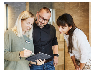
Une bonne conception grâce à des conseils avisés

Dans l'agitation du quotidien, il est facile d'oublier ces détails qui font la différence : les accessoires ne sont de loin pas de la simple décoration ! Lors de la conception de votre nouvelle salle de bain, pensez à vos besoins et à vos habitudes. En choisissant les bons accessoires, vous ne laisserez aucune chance au chaos. Nos spécialistes vous aideront volontiers à organiser votre salle d'eau.