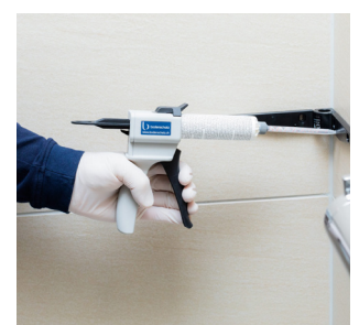
Coller ou percer : Adesio offre le choix de la fixation

Adesio vous donne le choix entre coller et percer. Le collage est simple : il ne génère ni bruit ni poussière et évite de fendre le carrelage. Le collage est sûr : il permet de fixer les accessoires sans risquer d'endommager les conduites et garantit l'étanchéité dans la salle de bain. Le collage offre plus de flexibilité : faciles à décoller, les accessoires peuvent être repositionnés aisément et il est possible de les monter sur du verre ou sur d'autres surfaces lisses. Et si vous préférez le montage classique, Adesio vous permet aussi de les visser.