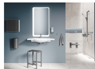
Série 477/801 : des éléments qui s'adaptent au gré des besoins

Les aménagements sanitaires sans obstacle n'offrent pas seulement un maximum de confort aux personnes souffrant d'un handicap physique ou psychique, mais aussi une simplicité d'utilisation à tout un chacun. Les miroirs, par exemple, peuvent être utilisés que l'on soit debout ou assis.