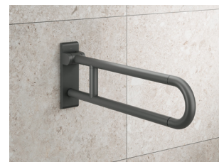
Série 477/801 : une ergonomie optimale dans la salle de bains

Les aménagements sanitaires sans obstacle misent sur la facilité de mouvement et sur l'accessibilité de tous les éléments dans la salle d'eau. Les produits favorisent un maximum d'autonomie devant le lavabo, sur les toilettes ainsi que sous la douche. Les robinets et tous les accessoires sont à portée de main et peuvent être actionnés sans effort.