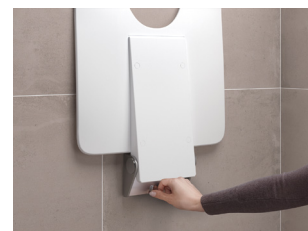
Système 900 : combiner les éléments selon les besoins

Les espaces sanitaires sans obstacle sont des solutions ou des systèmes conçus à partir de différents modules qui puisent dans une vaste gamme d'appareils et d'accessoires. Des éléments spécifiques – garnitures, poignées, sièges rabattables et dossiers – permettent d'aménager des salles d'eau adaptées aux besoins de chacun.