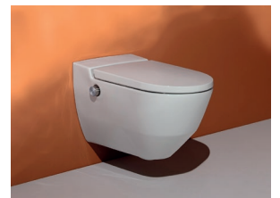
Eleganz und Funktionalität

Ein gutes Dusch-WC verbindet perfekte Hygiene mit einem angenehmen Reinigungsgefühl. Dazu ist ausreichend Wasser nötig. Das Cleanet Navia stellt 3,5 Liter frisches Wasser pro Minute in einem voluminösen Duschstrahl zur Verfügung. Der Duschkopf sitzt im Ruhezustand hinter einem Blendenring geschützt in der Keramik und wird vor und nach jeder Benutzung reichlich mit Wasser umspült.