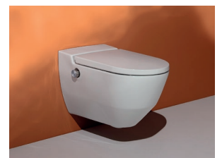
Fonctionnel et élégant

Tout WC douche de qualité associe une hygiène parfaite à une agréable sensation de propreté. L'opération exige suffisamment d'eau. Le Cleanet Navia fournit 3,5 l d'eau pure par minute en un jet puissant. Au repos, la douchette se loge dans la céramique, derrière une bague protectrice. Avant et après chaque utilisation, elle est abondamment rincée à l'eau.