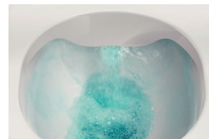
Finition sans joints ni rebord

Le WC douche Cleanet Navia est simple à nettoyer et convient donc parfaitement à un usage quotidien. Sans joints ni rebord, la céramique est aussi dotée d'une finition de surface LCC. Pour faciliter le nettoyage, le siège et l'abattant s'enlèvent en un tour de main.