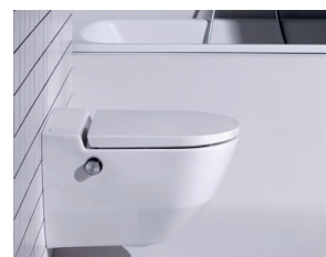
S'adapte à toutes les salles de bain

Étape confort dans l'évolution des lieux d'aisance, un WC douche peut être installé sans problème dans les salles de bain nouvelles ou existantes. Pour le montage et le démontage de Cleanet Navia , LAUFEN a prévu une plaque de raccordement compatible avec tous les réservoirs de chasse courants et un système de fixation doté d'un cache.