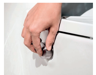
Un seul bouton pour toutes les fonctions

Un bouton rotatif sur le côté de la cuvette permet d'actionner aisément toutes les fonctions du WC. Outre enclencher la douche, il sert aussi à régler la position et la puissance du jet ou de choisir le mode oscillatoire.