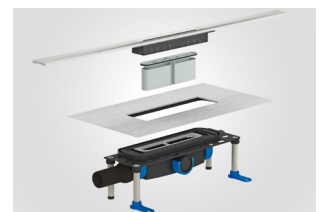
Modulares Ablaufgehäuse des DallFlex -Systems

Die unkomplizierte Reinigung von Sanitärinstallationen ist ein wesentlicher Faktor zur Unterstützung der Badezimmerhygiene. Duschrinnen-Systeme sind deshalb modular aufgebaut und können durch die Entfernung des Geruchverschluss einfach und auf bequeme Weise gesäubert werden.