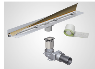
Aqua SwissLine mit niedriger Aufbauhöhe

Je nach Architektur des Badezimmers muss beim Einbau von Sanitärinstallationen eine gewisse Flexibilität bestehen. Duschrinnen-Systeme sind dank verschiedener Einbauhöhen und Längen problemlos an die bauliche Situation anpassbar. Je nach Anforderung sind sie in kleinen Bauhöhen erhältlich und sorgen dennoch für eine maximale Ablaufleistung.