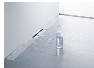
Duschrinne CeraWall Select, optimal auf das Design des Duschbereichs abgestimmt

Ein moderner Duschbereich muss nicht nur funktional sein, sondern auch ästhetischen Ansprüchen genügen. Duschrinnen sind aus hochwertigen Materialien gefertigt und in verschiedenen Oberflächen und Designs erhältlich. Sie lassen sich dadurch ideal an die Optik von jedem Duschbereich anpassen.