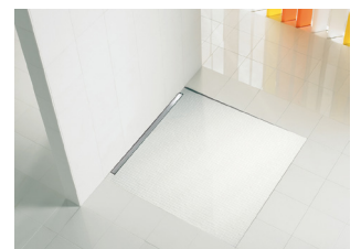
Duschboden mit minimalen Gefälleinschnitten und Duschrinne des Aqua SwissLine -Systems

Eine offene Raumgestaltung mit einem bodenebenen Duschbereich ist ein wichtiges Element modern gestalteter Badezimmer. Innovative Duschrinnen mit einer hohen Abflauleistung ermöglichen Duschbereiche mit minimalsten Gefälleinschnitten im Boden. Diese sind nicht nur optisch ansprechend, sondern stellen durch den schwellenlosen Eintritt auch ein Sicherheitsfaktor dar.