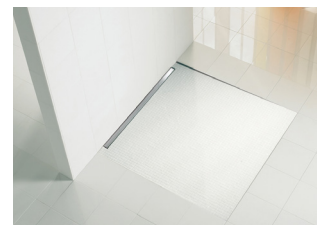
Receveur de douche avec découpes de pente minimales et rigole de douche du système Aqua SwissLine

Une pièce ouverte avec une douche au niveau du sol est un élément important d'une salle de bain moderne. Des rigoles de douche innovantes avec une capacité de drainage élevée permettent de réaliser des zones de douche avec des incisions de pente minimales dans le sol. Ce n'est pas seulement attrayant visuellement, mais représente également un facteur de sécurité grâce à l'entrée sans seuil.