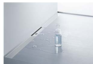
Rigole de douche du système CeraWall Select, harmonisée de façon optimale au design de l'espace douche

Une douche moderne ne doit pas seulement être fonctionnelle, elle doit aussi répondre à des exigences esthétiques. Les rigoles de douche sont fabriquées dans des matériaux de haute qualité et sont disponibles en différentes surfaces et exécutions. Cela permet de combiner esthétique et fonctionnalité pour chaque espace de douche.