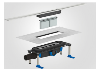
Corps d'avaloir modulaire du système Dall-Flex

Le nettoyage simple des installations sanitaires est un facteur essentiel pour l'hygiène de la salle de bain. Les systèmes de rigole de douche sont donc modulaires et peuvent être nettoyés facilement et confortablement en éliminant les pièges à odeurs et en supprimant le siphon intégré.