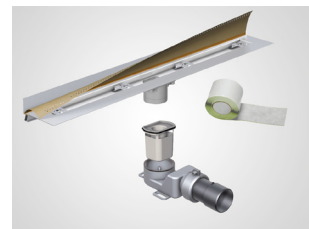
Aqua SwissLine avec faible hauteur de montage

Selon l'architecture de la salle de bain, il faut une certaine flexibilité dans l'installation des produits sanitaires. Grâce aux différentes hauteurs et longueurs d'installation, les systèmes de rigoles de douche s'adaptent facilement à la situation. Selon les besoins, ils sont disponibles dans des hauteurs plus petites tout en assurant une performance de drainage maximale.