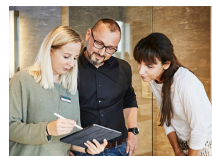
Wir betreuen Sie persönlich, von A bis Z

Im 3-stufigen Absatzmarkt bieten wir zusammen mit Herstellern und Installateuren begeisternde, termingerechte und funktionierende Badezimmereinrichtungen an. Dabei übernimmt jede Stufe diejenigen Aufgaben, für welche sie die Kompetenzen aufweist, ausgebildet und eingerichtet ist. Der dreistufige Absatzmarkt ist der Weg zum Vorteil aller Beteiligten.