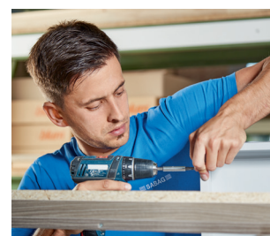
Der Werkplatz Schweiz liegt uns am Herzen

Wir achten darauf, dass der Grossteil der Wertschöpfung im Inland bleibt. Wir setzen auf starke und nationale Partnerschaften und stellen in unserem Werk in Nidau in Eigenproduktion Badezimmermöbel und Küchen nach Mass her. Auf diese Weise festigen wir den Werkplatz Schweiz, gewährleisten maximal mögliche Verfügbarkeit und halten die Produktqualität hoch. Mit dem Logistikeubau Sanitär am Hauptsitz in Biel investierten wir neulich in modernste Intralogistik und bauten gleichzeitig die Lagerkapazität massiv aus.