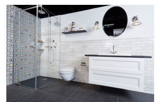
In 4 Schritten zum Traumbad gelangen

Mit unserem Online Badgestalter können Sie mit wenigen Klicks Ihre Bad-Ideen zu digitaler Realität werden lassen. Die im Hintergrund automatisch generierte Artikelliste bietet Ihnen anschliessend die perfekte Grundlage, um ein auf Sie abgestimmtes Angebot bei uns anzufordern. Gestalten Sie Ihr Traumbad unter badgestalter.sabag.ch .