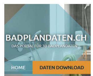
Produktdetails jederzeit griffbereit haben

Unsere digitalen Angebote und Auftragsbestätigungen sind mit Detailinformationen zu den Produkten verknüpft. Mit einem Klick auf die Artikelnummer landen Sie in unserem Productfinder. Diesen finden Sie übrigens auch unter sabag.teamonline.ch . Für unsere SABELLA-Badezimmermöbel aus eigener Produktion und für unser Eigensortiment modico stellen wir Profis zudem hochaufgelöste 3D-Daten zur Verfügung. Diese Daten sind auf badplandaten.sabag.ch verfügbar.